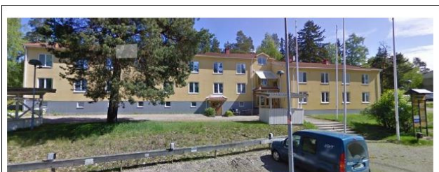
Flottiljgatan 61, Hässlö Västerås

Välkomna till vår nya lokal hälsar styrelsen.